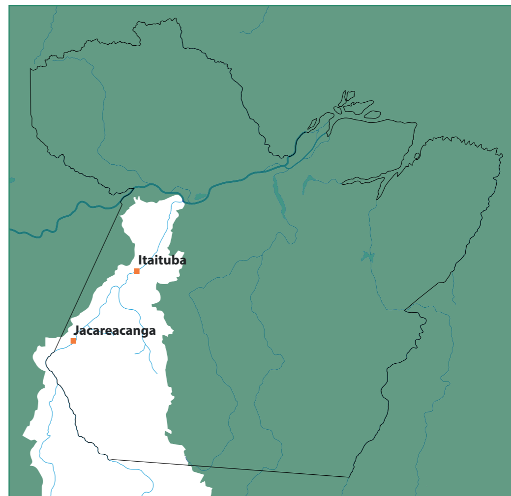
FIGURA 2. BACIA DO RIO TAPAJÓS NO ESTADO DO PARÁ E PRINCIPAIS CIDADES