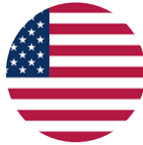
الولايات المتحدة الأمريكية