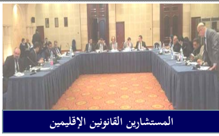
المستشارين القانونيين الإقليميين

في نيسان/أبريل، نظم المكتب ورشة عمل لمدة ثلاثة أيام في عمان، الأردن، بشأن "مراجعة مشروع قانون مكافحة الإرهاب وفقاً للضوابط القانونية الدولية لمكافحة الإرهاب وقرارات مجلس الأمن الدولي ذات الصلة"،