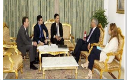
فريق المكتب ووزير العدل

قدم المكتب إلى معالي السيد عمر منصور، وزير العدل التونسي، وغيره من أصحاب الشأن الرئيسيين في سلطات السجون التونسية المبادرة الجديدة للمكتب لتحسين الخدمات الصحية في السجون، والتي تهدف إلى تعزيز سبل وصول نزلاء السجون التونسيين إلى خدمات الوقاية والعلاج