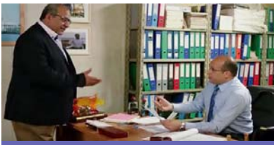
على اليسار: الممثل بيومي فؤاد

أطلق المكتب، بالتعاون مع اللجنة الوطنية التنسيقية لمكافحة الفساد، حملة إعلامية وطنية لمكافحة الفساد في مصر، تحت شعار "بقصد أو بحسن نية، الفساد خسارة عليك وعليه!". والحملة التي بدأ بثها في أوقات ذروة المشاهدة التلفزيونية في شهر رمضان سوف