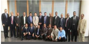
الخبراء اليمنيون المتدربون

عقد المكتب أربع فعاليات لمسؤولي العدالة الجنائية وإنفاذ القانون اليمنيين، عُقد أول ثلاث منها في الأردن في أيار/مايو لثمانية عشر مسؤولاً من مسؤولي العدالة الجنائية (قضاءً ومدعين عامين)، وركزت على التحقيق في القضايا المتعلقة بالإرهاب. وشمل نشاطان منها دراسات حالة وإجراءات المحاكمة الصورية، مع التركيز على تمويل الإرهاب والعناصر التي تفضي للإرهاب كالتحريض والتحرير. بينما ركز النشاط الثالث على التهديدات المستجدة المرتبطة بتمويل الإرهاب، والرابع تضمن تدريباً متخصصاً على مكافحة استخدام الإنترنت لأغراض الإرهاب، متضمناً زيارة دراسية إلى قسم المعلومات في الحرس المدني الأسباني في حزيران/يونيو للتعرف على أحدث التقنيات والأساليب المطبقة لإجراء التحقيقات الإلكترونية وتحليل الأدلة الرقمية. ونتيجة لذلك، أنشئت وحدة متخصصة لمواجهة استخدام الإنترنت لأغراض الإرهاب في اليمن. مولت المشروع اليابان.