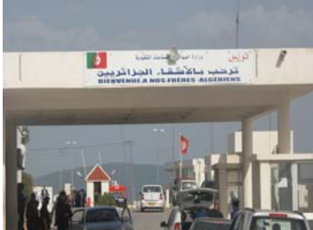
زيارة ميدانية لأمن الحدود

شارك المكتب في 26 أيار/مايو الجمارك التونسية في زيارة ميدانية لمعبري ببوش وملولة الحدوديين الواقعين على الحدود الجزائرية-التونسية. وقد نظمت هذه الزيارة إدارة الجمارك كجزء من التعاون القائم بين السلطات التونسية ومنظمة الجمارك العالمية والجمارك الصينية وبين المكتب. وقد أقيمت