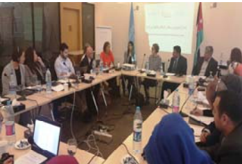
اجتماع الشركاء والخبراء

عقد المكتب بالتعاون مع تمكين ومركز موارد الأعمال التجارية وحقوق الإنسان [الأردن]، ورشة عمل في نيسان/أبريل بشأن "العمال المهاجرون ومخاطر الاستغلال والاتجار في الأردن". وفرت هذه الورشة منبرا لأصحاب الشأن والخبراء لمناقشة التحديات الوطنية والدولية