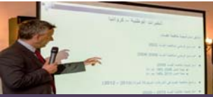
عرض استراتيجيات مكافحة الفساد

تلقت هيئة الرقابة الإدارية على مدار الثلاثة أشهر التي تغطيها النشرة المساعدة التقنية من المكتب. حيث عُقدت ورشة عمل في يوليو/تموز لمناقشة العقبات بوجه مصر في تنفيذ إستراتيجيتها الوطنية لمكافحة الفساد والتعرف على التحديات وتقديم أفضل الممارسات والتوصيات ذات الصلة إلى الحكومة المصرية. إضافة إلى ذلك عقد برنامج تدريبي حول التحقيقات الأولية والمتقدمة في جرائم الفضاء الإلكتروني في أغسطس/آب من خلال ٣٨ جلسة على مدار أسبوعين لمشاركين من خلفيات متنوعة. كما عقدت ورشة عمل أخرى عن "أفضل الممارسات في تطبيق مجمع خدمات الاستثمار في مصر" في سبتمبر/أيلول قدمت فيها المهارات والأدوات اللازمة لتنفيذ هذا النموذج في مصر لـ ٤٧ مسؤولاً حكومياً وناقشتها بهدف سد الثغرات المحتملة وتحديد الاحتياجات لإدخال المزيد من التحسينات. المشروع يتولى الاتحاد الأوروبي.