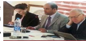
إيجاز ما تحقّق من منجزات

بلغ برنامج "تدريب ممرضى الطب الشرعي على العنف الجنساني" الذي ضمّ عشرين ممرضاً وهدف إلى تطوير مهاراتهم ومعارفهم للمساعدة في إدارة وفحص ضحايا العنف الجنسي والجنساني، نهايته بعقد آخر تدريب له في شهر أغسطس/آب برام الله. وقد تضمن التدريب النهائي نقاشات، شملت مناقشة حالة، عن المهام التي قامت بها كل مجموعة من المستشفيات الخمسة المشاركة في التدريب حول سجل المريض، والآراء المستفاد، وصيانة المرافق والتطوير المهني المستمر. وخلال الحفل الختامي، قُدم بإيجاز المنجزات التي تحققت والتقدم المحرز في إنشاء عيادات للطب الشرعي في أربعة مستشفيات فضلا عن الأنشطة المستقبلية. يُنفذ هذا البرنامج بالشراكة مع وزارتي العدل والصحة الفلسطينيتين بتمويل من كندا.