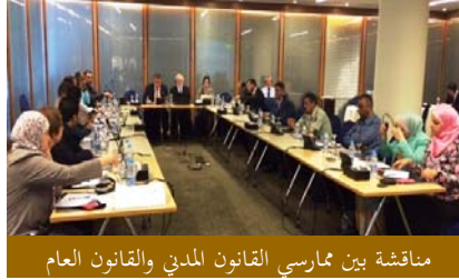
مناقشة بين ممارسي القانون المدني والقانون العام

عقد المكتب ورشة عمل بشأن "المكونات الأساسية لتدابير فعّالة مانعة للإرهاب في إطار تصدي العدالة الجنائية لها" في عمان في أغسطس/آب، وذلك كجزء من خطة العمل التي وضعتها الأردن مع المكتب. وقد افتتح الورشة