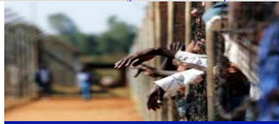
فيروس نقص المناعة البشرية ونزلاء الأماكن المغلقة

عمل المكتب لما يربو عن عقد من الزمان مع المغرب، وهي بلد ذو أولوية عالية، للدفع قدماً بأجندة الحدّ من الضرر في المجتمعات والسجون. وفي الوقت الراهن، يعمل المكتب على مساعدة الشركاء