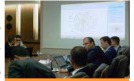
عرض أدوات تحليل الجريمة

يدعم المكتب السلطات التونسية في جهودها الرامية لمنع ومكافحة الجريمة المنظمة والإرهاب من خلال برنامج تجريبي عن التحليل الجنائي، قام من خلاله تسليم البرمجيات والمعدات وقدم التدريب للمهنيين المتفرسين من مختلف الأجهزة التابعة لوزارة الداخلية. وقد انتهت المرحلة الأولى من البرنامج في أغسطس/آب باحتفالية رسمية بالوزارة عرض خلالها محققون من قوى الأمن الداخلي المهارات التي اكتسبوها خلال التدريب. وتشمل هذه المهارات إجراء تحقيقات سريعة وفعالة للجرائم والشبكات الإجرامية بالاستعانة بالبرنامج الذي قدمه المكتب لهم. وبهذه المناسبة، التقى الممثل الإقليمي للمكتب بمعالى وزير الداخلية، السيد محمد ناجم الغرغلي، لمناقشة سبل التعاون المستقبلي بين المكتب وتونس في مجال إنفاذ القانون والعدالة الجنائية. هذا المشروع بتمويل من الولايات المتحدة الأمريكية.