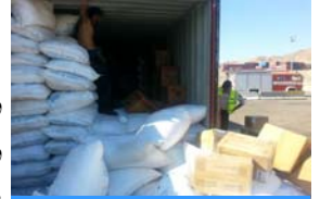
تفتيش البضائع في ميناء العقبة

٢٠١٥. وهي تضم ضباطا من الجمارك والشرطة والمخابرات ممن يعملون سويا على تحليل المخاطر وتفتيش الحاويات. وكان المكتب قد زود الوحدة فيما سبق بما يلزم من معدات وتدريب على استخدام برامج الاتصال وتحليل المخاطر إضافة إلى تفتيش الحاويات.