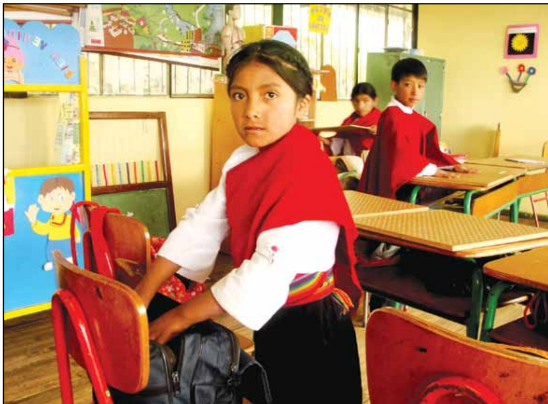
Centro Educativo Comunitario Intercultural Bilingüe Caupolican