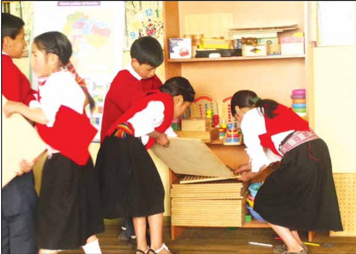
Centro Educativo Comunitario Intercultural Bilingüe Caupolican