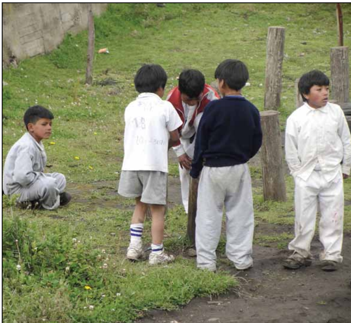
Centro Educativo Comunitario Intercultural Bilingüe Mushuk Ñan